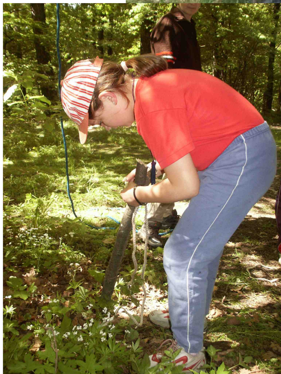
Příklad plnenia kontroly VIAZANIE UZLOV